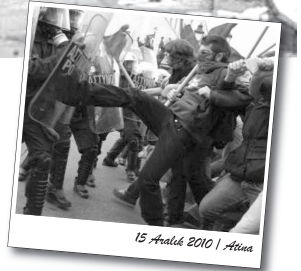
15 Aralık 2010 | Atina

Polisin başkent Dakka ve Narayangaj kentlerindeki gösterilere müdahalesi sırasında ise 100 kişi yaralandı. Kapitalistler ve onların koruyucusu polis ise, fabrikaları mümkün olan en kısa sürede yeniden açma derdine düştü. Tekstil işçilerinin asgari ücreti birkaç ay önce artırılmıştı, ancak protestocular