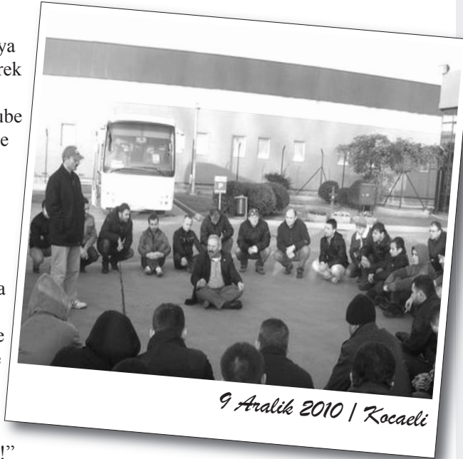
9 Aralık 2010 | Kocaeli