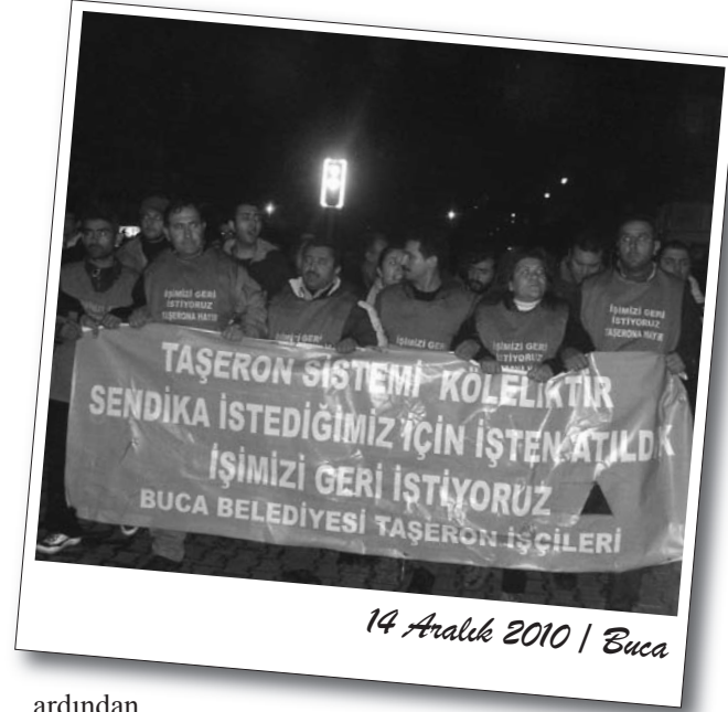
14 Aralık 2010 | Buca

Kitle ise çadırı savunacağını söyledi. Çevik kuvvet barikatının önünde halaylar çekilmeye başlandı. Bu sırada atılan işçiler aralarında bir toplantı olarak durumu değerlendirdiler. Uzun süren bekleyişin