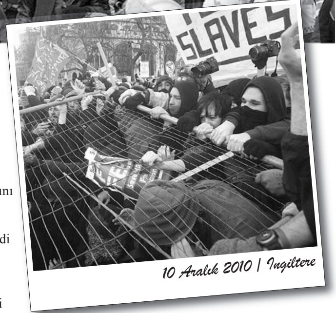
10 Aralık 2010 | İngiltere

Ancak öğrenci eylemlerinin dikkat çeken bir yönü ise işçi sınıfının desteğinden yoksun olmasıdır. Çocukları için yüksek harçlar ödemek zorunda kalacak olan da işçi-emekçilerdir. Bu da gençlik hareketinin gücünü sınırlamaktadır, saldırıyı