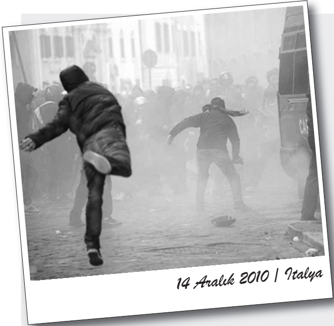
14 Aralık 2010 | İtalya