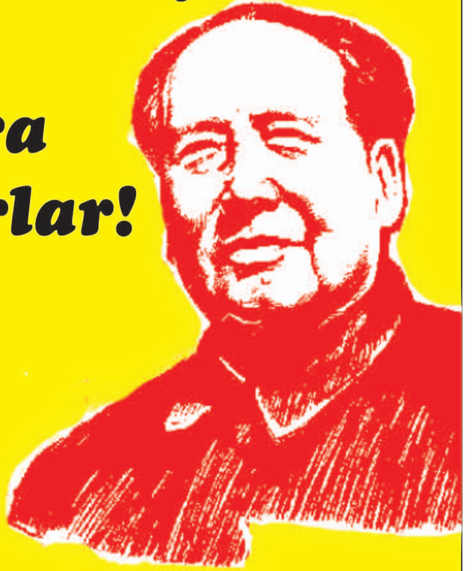
Mao Zedung 1893 - 09 Eylül 1976