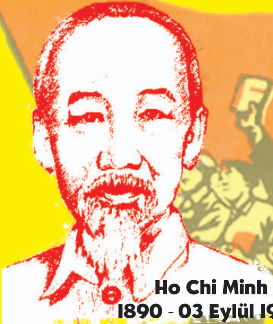
Ho Chi Minh 1890 - 03 Eylül 1969