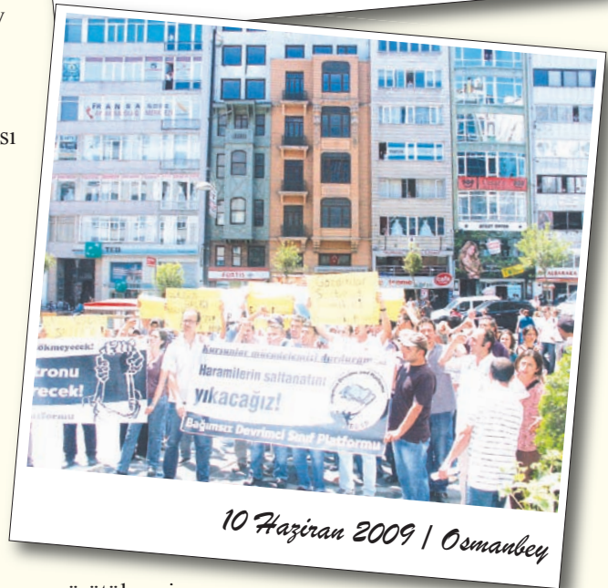
10 Haziran 2009 | Osmanbey

yürütülmesi mümkün olacaktır. Sabra örneği sözkonusu olduğunda, "BDSP'liler serbest bırakılsın, patronlar yargılsın!" talebi bu bakımdan işlevsel bir taleptir. Daha genel planda ise "Sınırsız söz, basın, toplanma ve örgütlenme hakkı!" talebinin yükseltilmesi önem taşımaktadır.