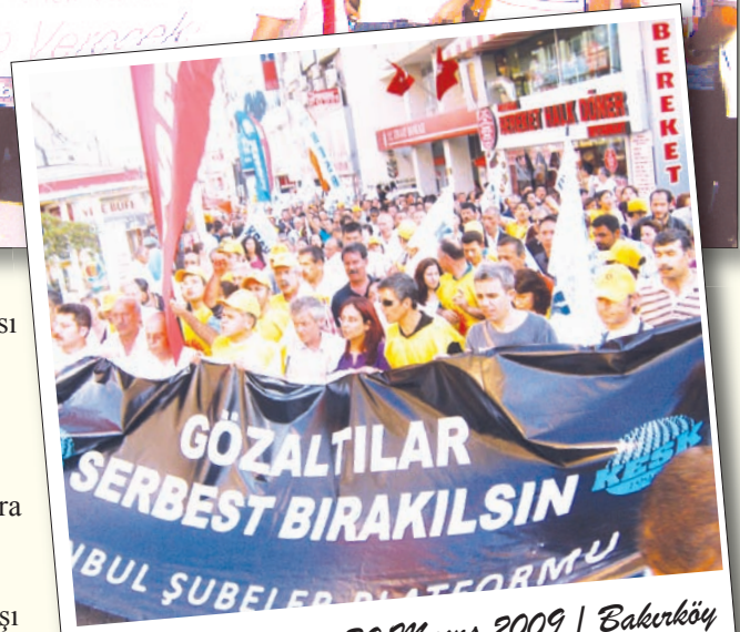
30 Mayıs 2009 | Bakırköy

Saldırılara karşılık yürütülen ajitasyon ve teşhir çalışmasıyla ortaya çıkarılan duyarlılıklar, somut talepler yoluyla bilinçli eylem yoluna sokulabilecektir. Bu ölçüde de kararlı ve uzun soluklu bir mücadele