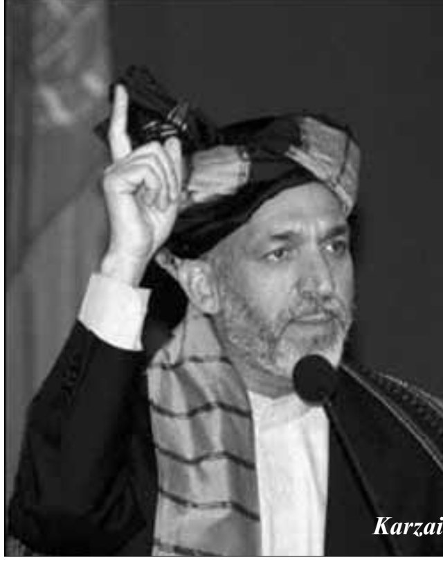
Amerika'nın bulduğu çözüm şimdiye kadar kullandıkları tüm iddiaları geçersiz kılıyor. Zira Afganistan'a saldırının en temel gerekçesi "baş

Aradan geçen sürede görüldü ki, ne işgalciler, ne de Amerikan kuklası Karzai yönetimi halkın desteğini alabilmiştir. Afgan halkı kendilerini "demokrasiye kavuşturanları" ne hikmetse benimsemedi. Destek bir yana işgalciler sık sık saldırılara maruz kalmaya başladılar. Bu saldırılar sonucu bir çok asker öldü ya da yaralandı. İşgalcilerle uşakları Başkent Kabil'de bile doğru dürüst bir denetim kuramadılar. Durumları gittikçe zora giren Amerikan güçleri içine düştükleri aciz durumdan çıkış yolları bulma arayışına girdiler.